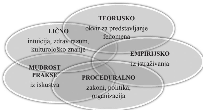
Šema 1. Model profesionalnog znanja (Drury Hudson, 1997)

Osmond i O’Konor navode da praktičare „etika upućuje da za usmeravanje sopstvene prakse koriste znanje koje najbolje može da odgovori na zahteve” (2006:14), što su zapravo znanja koja će proizvesti najpovoljnije učinke kod klijenta. Ovo takođe upućuje na to da je praktičarima potrebno da nedvosmisleno razumeju tipove znanja koja potencijalno mogu da deluju na njihovu praksu. U isto vreme, sve više istraživanja ukazuje da praksu socijalnog rada obično ne usmeravaju teorije i rezultati empirijskih istraživanja već stečeno praktično iskustvo, kao i da se socijalni radnici oslanjaju na neke tipove znanja više, a na neke manje.